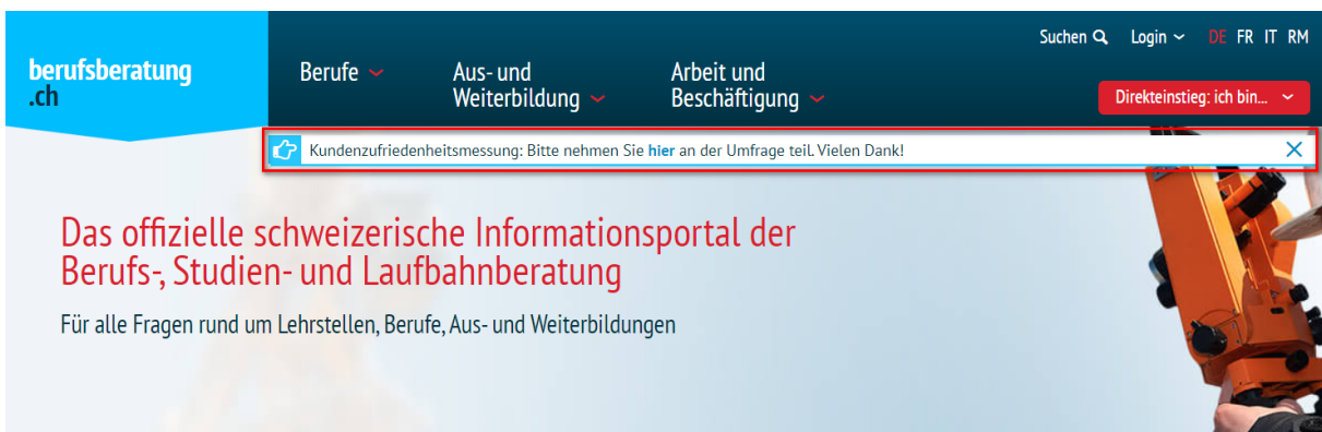
Beispiel einer möglichen Meldung

Bis jetzt bestand lediglich die Möglichkeit, eine Störungsmeldung oder eine Meldung über ein Wartungsfenster einzublenden. Dies wird weiterhin der Fall sein. Neu kann auch eine Nachricht eingeblendet werden, um zum Beispiel auf eine aktuelle Umfrage hinzuweisen: